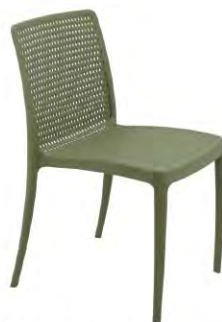
Línea Isabelle Fabricada en tecnopolímero de polipropileno y fibra de vidrio.