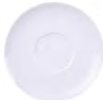
Plato café 15 cm