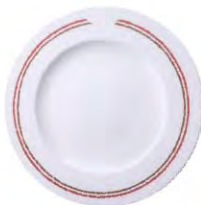
Plato llano 28 cm Classic