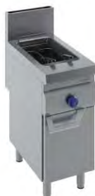
Freidora A Gas América 18 L