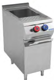
Cocedor De Pastas A Gas Con 1 Cuba De 26 Litros Europa