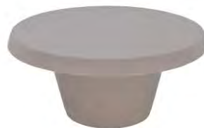
Mesa de centro Cona fabricada en tecnopolímero de polietileno.