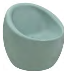
Poltrona Oca Rotomoldeada fabricada en tecnopolímero de polietileno.