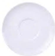
Plato té 15 | 13cm