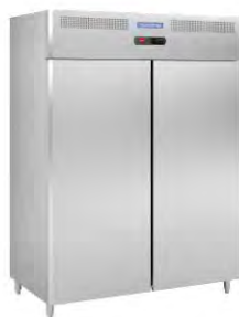
Refrigerador Profesional 2 Puertas