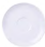
Plato café 13 cm