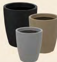
Maceta Thai 48 cm | 58 cm | 67 cm