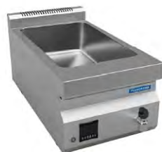
Baño María Eléctrica América Countertop