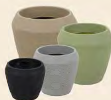
Maceta Egipcio 29 cm | 39 cm | 45 cm | 54 cm