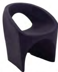
Sillón Jet Rotomoldeada fabricada en tecnopolímero de polietileno.