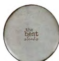
Plato llano 28 cm Rustic