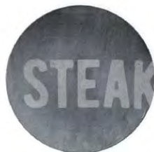
Plato llano 28 cm Stone