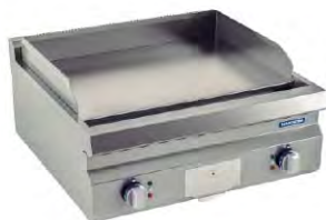
Plancha Eléctrica cooktop Línea 700