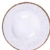
Plato pasta 27 cm