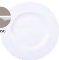
Plato raso 28 cm | 27cm | 21 cm