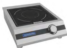
Estufa de inducción Portatil 1 puesto