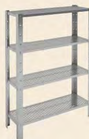
Estante Perforado Acero Inoxidable Aisi 430