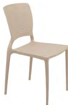
Línea Safira Fabricada Tecnopolímero de polipropileno y fibra de vidrio.