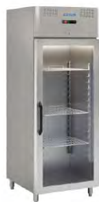
Frigorífico Profesional 1 Puerta De Vidrio