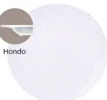
Plato hondo 21 cm