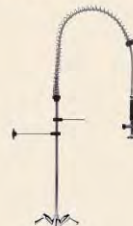
Boquilla Con Mezclador Fijación De Mesada