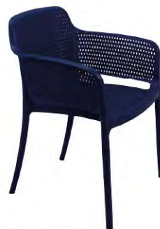
Línea Gabriela Fabricada Tecnopolímero de polipropileno y fibra de vidrio.