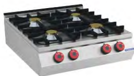
Cocina A Gas Europa 4 Bocas Countertop